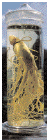
Ginsengrot – värd sin vikt i guld.