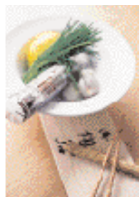
Mat lagad med ginsengrot anses som en delikatess.

Efter skörden tvättar och rensar man rötterna, och för att få vit ginsengrot torkas de i solen.