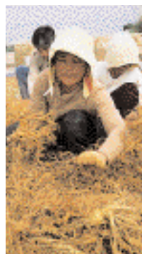
Skörden sker på hösten. Man arbetar mycket varsamt.